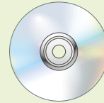
■サーバ接続ソフト