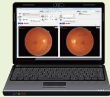
■パソコン (OS: Windows7以上)