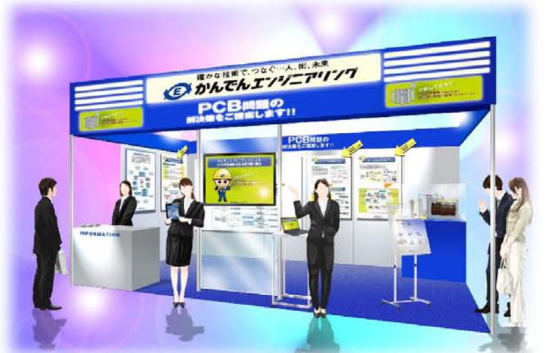
※会場のイメージですので実際とは異なることがあります。