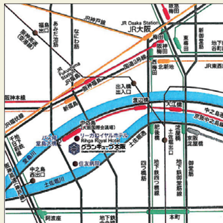
京阪電車中之島線中之島駅2番出口から徒歩1分

受講を希望される方は、下の受講申込書に必要事項をご記入の上、 FAXにて お申込み下さい。