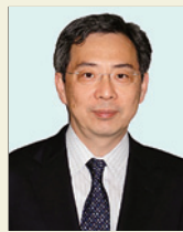
村上 晶 教授